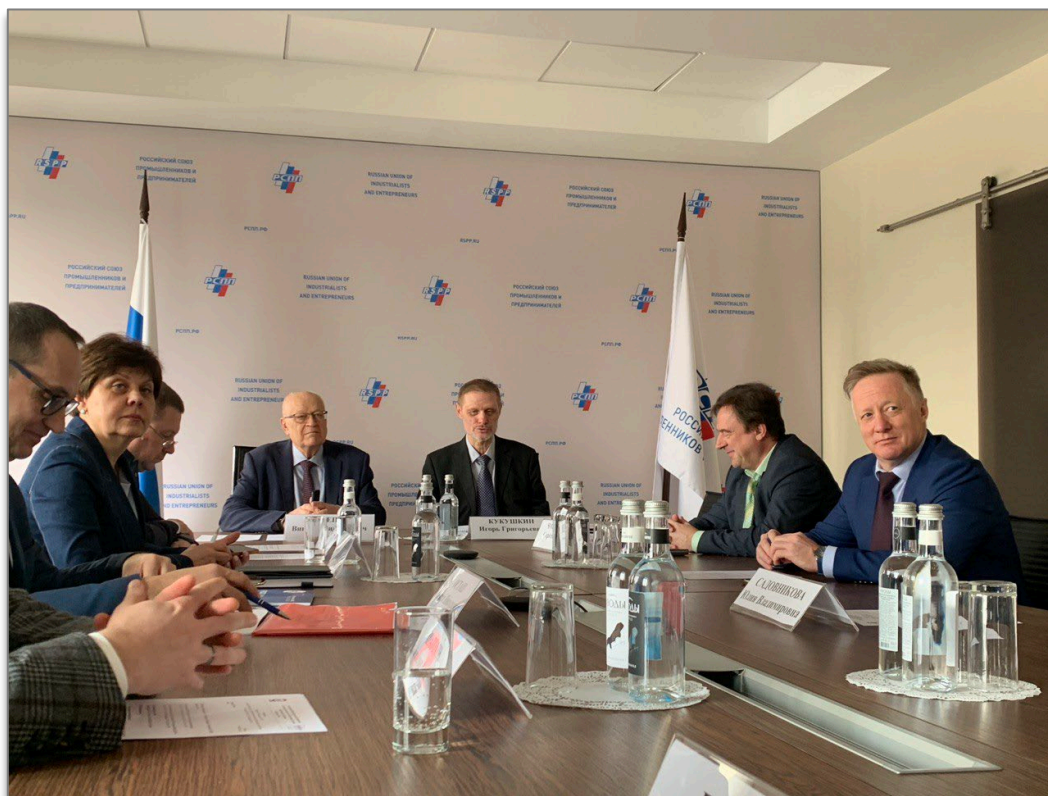
Фото: Собрание 03 марта 2025 г., архив АНО «Здоровье 360»

27 февраля 2026 года в Российском Союзе Промышленников и Предпринимателей состоится собрание Учредителей и Партнеров АНО «Здоровье 360»