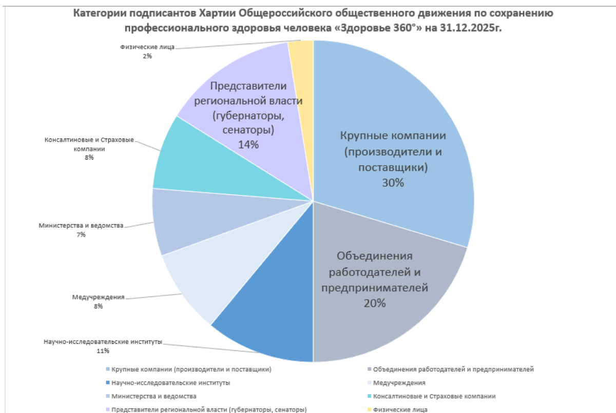
Диаграмма на основе данных Реестра подписантов Хартии:

Общественное Движение «Здоровье 360» (учредители: РСПП, ОАО «РЖД» НО РСХ), как площадка для открытого диалога социально ответственных работодателей, регулятора, а также профессионального и научного сообщества, проводит ежегодно общественные мероприятия в виде подписания Хартии движения.